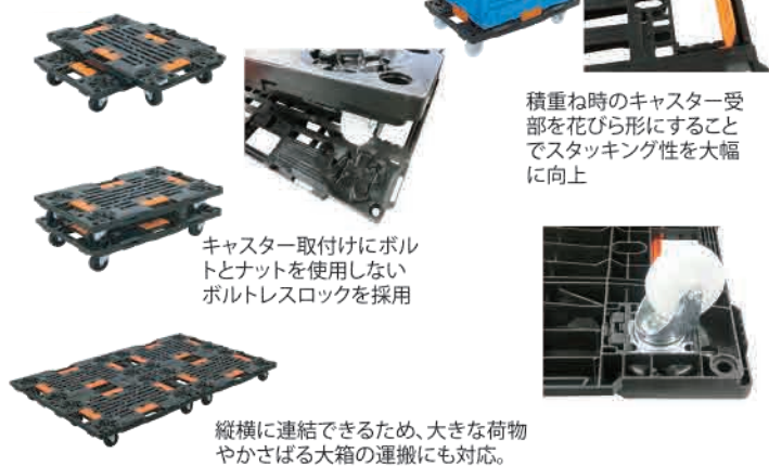
積重ね時のキャスター受 部を花びら形にすることで スタッキング性を大幅 に向上