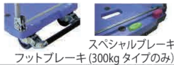
スペシャルブレーキ フットブレーキ (300kg タイプのみ)