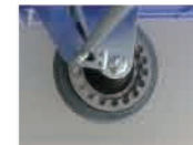
ギア方式の 安全ストッパー機能 です。

◎発送はメーカー出荷となります。◎送料 (実費) は、別途費用が必要となります。